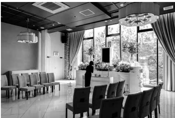
ウイズハウス 新宮 滝が見える式場

のシーンを想像して、そしてイメージした通りに体験していただけるような式場にしたい。そのためには、現場のスタッフが想いや意味を語るような材料がなければいけません」