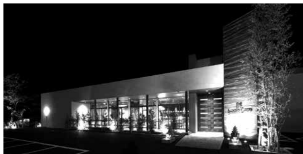
勝浦斎場ザ・スランパーズガーデン 外観

「スランパーズガーデンを建てる時は会館自体に意味をもたせたいと考えました。この勝浦の土地にはしっかりとした歴史的背景がありました。千年以上前からの習わしですが、補陀洛山寺の住職は60歳ごろになると補陀洛渡海（ふだらくとかい）とい