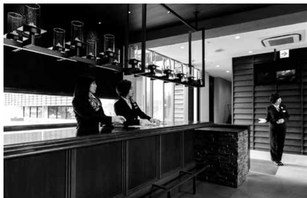
ウィズハウス 新宮 内観