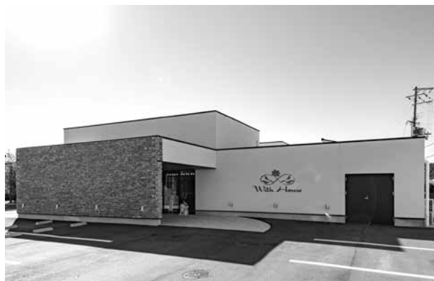
ウィズハウス 新宮 外観