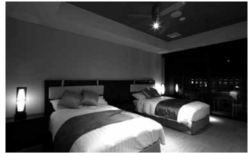
宿泊可能なベッドルーム