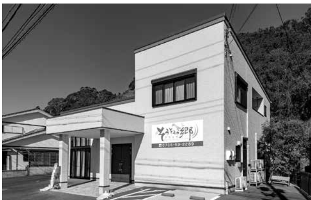
太地町「そうそうの郷 太地」