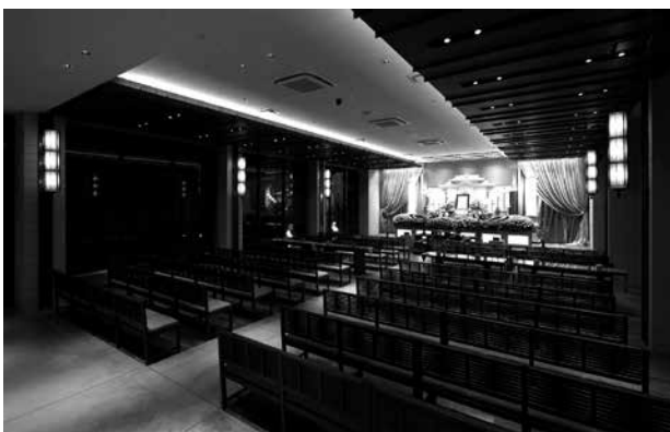
要望に応じて2つの式場を用意

う修行を行っていたそうです（南の海の果てに補陀落浄土があるとされ、南海の彼方の補陀落を目指して船出することを補陀落渡海という）。前後左右4つの鳥居のついた小さな屋形船に30日分の食料と灯火油を積みこみ、渡海僧は屋形の中に入り、外から釘を打たれ出られない状態で海に出ます。自らの心身を南海にて観音に捧げ、観音浄土に生まれ変わることを願う捨身行だったと言われています。街にはその時の船を復元したものが実際に存在します。大変歴史ある土地だったので、そこに想いをのせてみました。大切な人を送り出すという人の気持ちは千年前も今もかわらないのではないかと思います、海へと向かう住職のように、同じ方向に向かって送り出せるコンセプトをもった会館になりました」